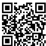
QR kód 1a.1

Útvonal: Pretul, Rosegger Schutzhaus - Hauereck Schutzhaus - Jägerhöhe - Waldschule és Peter Rosegger szülőháza (opcionális) - Lendkreuz - Teufelsteingipfel - Zeller Kreuz - Fischbach