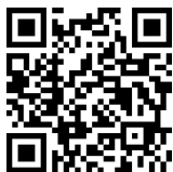
QR kód 1a.1

Útvonal: Pretul, Rosegger Schutzhaus - Hauereck Schutzhaus - Jägerhöhe - Waldschule és Peter Rosegger szülőháza (opcionális) - Lendkreuz - Teufelsteingipfel - Zeller Kreuz - Fischbach