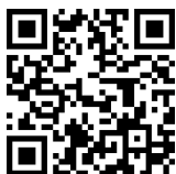
QR kód 1.1

Útvonal: Feistritzsattel - Poirhöhe - Sonnwendstein (opcionális) - Erzkogel - Hirschenkogel felvonó felső állomása - Semmering