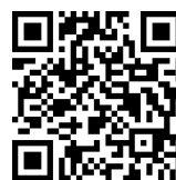
QR kód 4.1

Útvonal: Bernstein főtere – Steinstückl – Redlschlag (Redlshöhe) kilátópont – Kalteneck – Habich – Hutwisch – Hutwisch parkoló (Hochneukirchen)